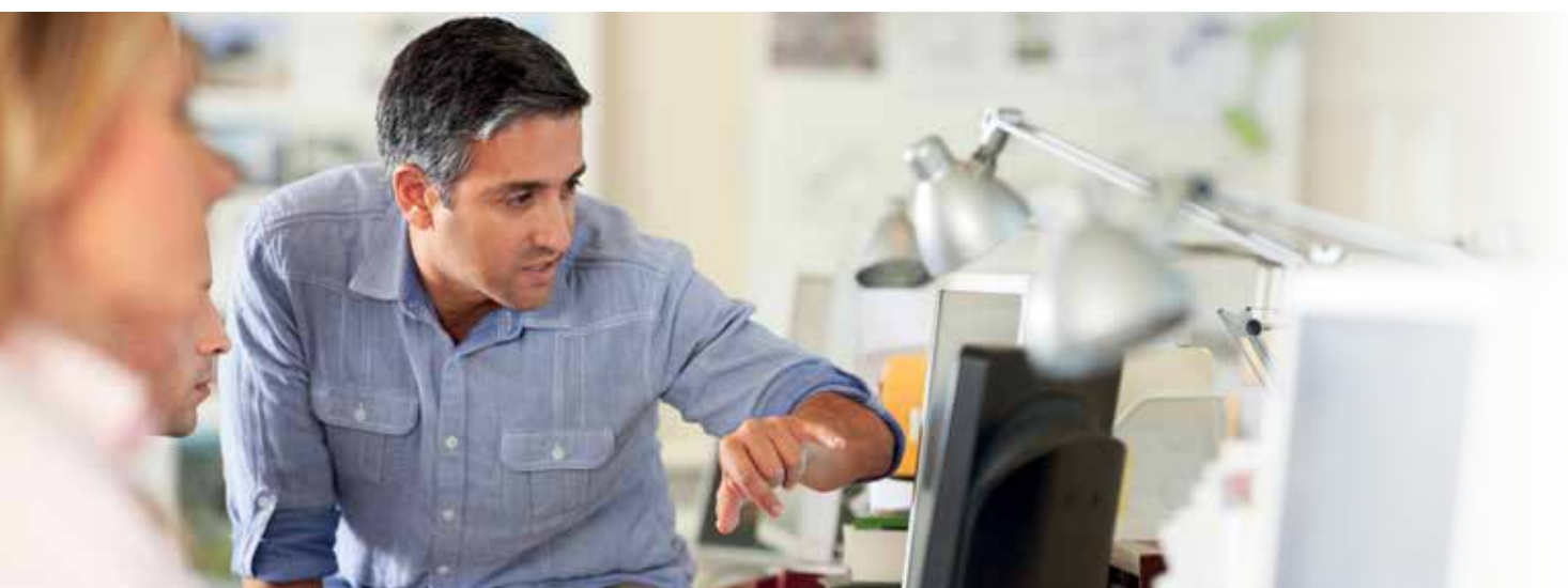
Lønsatser pr. måned 1. marts 2017-29. februar 2020