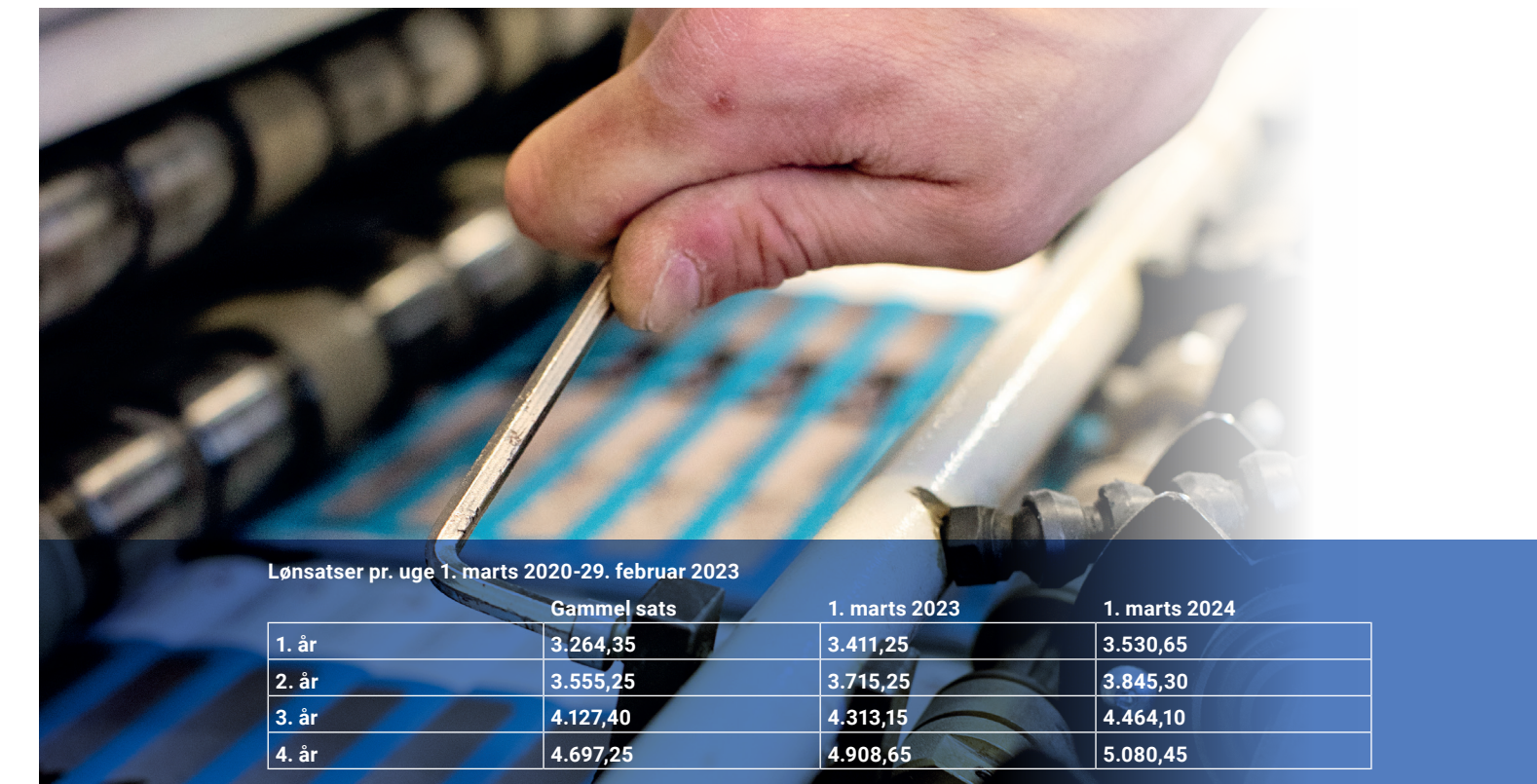
Lønsatser pr. uge 1. marts 2020-29. februar 2023